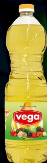
Aceite s/ 8 a 13.