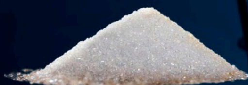
Azúcar s/ 3.80 kg