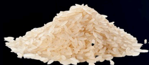
Arroz s/ 3.80 kg

Desabastecimiento de GLP afecta precios en la canasta básica.