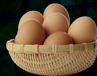
Huevos s/10 s/19