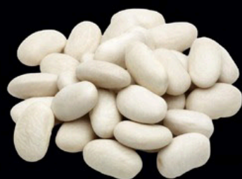
Frejol s/ 15 kg