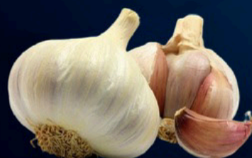
Ajos s/12 kg