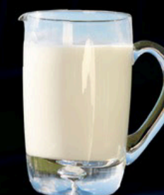
Leche s/ 3.80