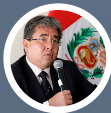
NELSON SHACK Contralor General

"En el 2021 hemos perdido por corrupción más de 24 mil millones de soles. Como lo he manifestado en reiteradas oportunidades, la corrupción es el principal problema público y estructural que tiene nuestra sociedad".